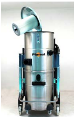
Filtro HEPA incluido (antes del motor). 99.97% eficiencia en 0.3 micrones