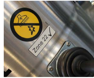
Sacudidor de filtro manual (vista externa)