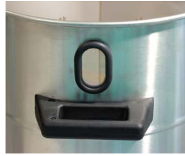
Merilla instalada sobre el contenedor de recuperación de material