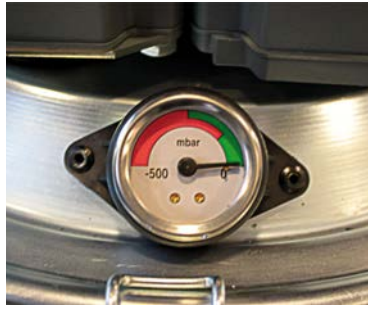
Indicador de obstrucción del filtro