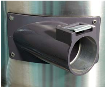
Conexión de manguera de succión hecha de aluminio con un diámetro de 70mm