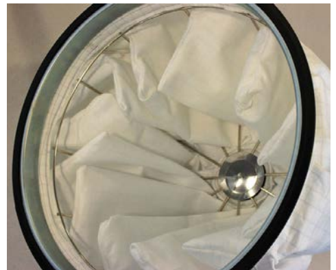
Filtro principal de poliéster en forma de estrella