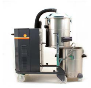
Contenedor de recuperación de material reamovible (vista lateral)