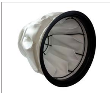
Filtro principal de poliéster en forma de estrella