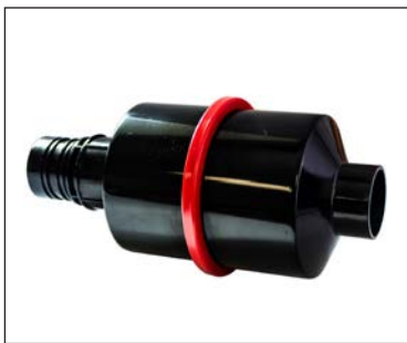
Silencieux d'échappement amovible