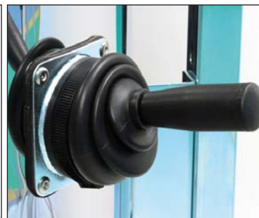
Secoueur de filtre (vue externe)