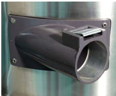
Conexión de manguera de succión hecha de aluminio con un diámetro de 70mm