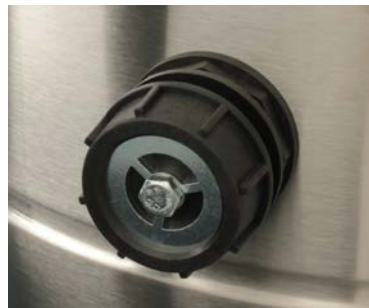
Vàlvula de presiòn