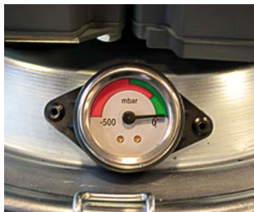
Indicador de obstrucción del filtro