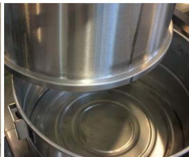
Tanque de recuperaciòn desmontable