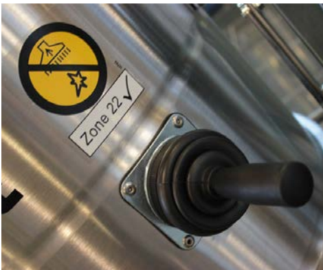
Sacudidor de filtro manual (vista externa)