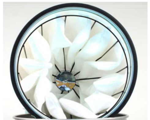
Filtre Polyester principal en forme d'étoile