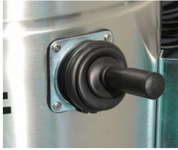
Secoueur de filtre (vue externe)