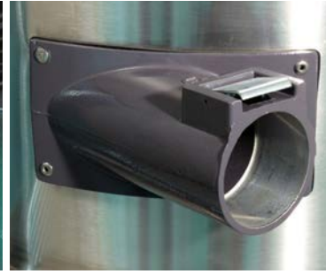
Prise d'Aspiration de 70mm (en Aluminium)