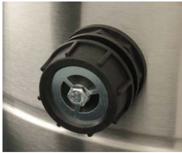
Soupape de dépression