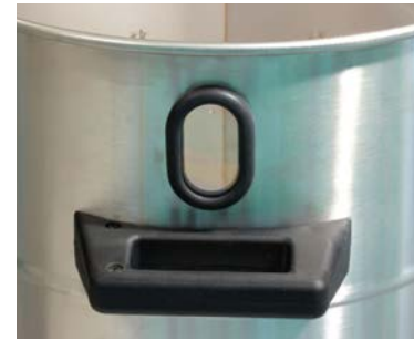
Voyant installé sur le réservoir de récupération