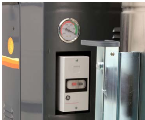
Indicateur d'obstruction du filtre. Démarreur manuel avec protection de surcharge..