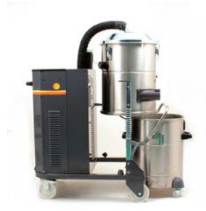
Cuve de récupération détachable (vue latérale)